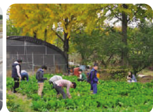
▲ 재배에서 수확까지