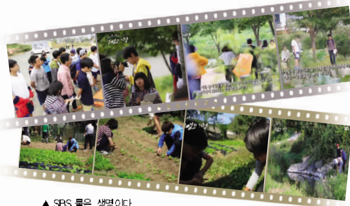
▲ SBS 물은 생명이다