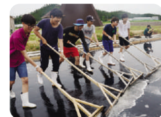
▲ 신안군 증도 염전 체험